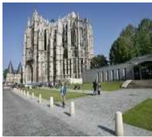
Cathédrale de Beauvais

Patrimoine mondial de l'UNESCO. Véritable prouesse technique, la cathédrale Notre-Dame d'Amiens témoigne d'une grande harmonie architecturale. Construite de 1220 à 1288, ses dimensions en font un des plus vastes édifices gothiques jamais élevés : 145m de longueur, 42m de hauteur et un volume total de 200 000 m3. Sa statuaire est aussi remarquable que son architecture. Depuis la restauration de sa façade occidentale, Notre-Dame s'impose comme la principale référence dans la découverte de la polychromie des portails gothiques. Cette révélation a donné naissance au spectacle "Amiens, la cathédrale en couleurs" qui restitue les couleurs médiévales des portails par la magie de la lumière.