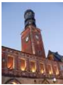
Beffroi de Doullens