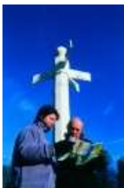
Forêt de Compiègne

La forêt domaniale de Compiègne compose avec celles de Laigue et de Retz, un ensemble de 3200 ha. Cette hêtrière-chênaie est la 3ème forêt domaniale française de par sa taille (14500 ha) après Orléans et Fontainebleau. Sillonnée par plus de 1000 km de routes et chemins, elle permet à tous un grand nombre de promenades ou randonnées. A découvrir : la percée des Beaux-Monts, le sentier thématique du Mont Saint-Pierre, le circuit des étangs ou encore le sentier sportif du Grand Parc. le parc d'aventure dans les arbres aux étangs Saint-Pierre. Tél. : 03.44.40.02.75.