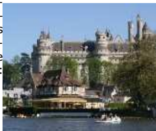
Château de Pierrefonds

Chef-d'œuvre architectural du XVIIIe siècle, les Grandes Ecuries du domaine de Chantilly abritent 30 chevaux de spectacles et proposent tous les jours à 14h30 "Chevaux en fête", une heure d'animation équestre. D'avril à novembre, le spectacle équestre "les Princes de Chantilly" nous fait vivre l'histoire du domaine, et en décembre le spectacle de Noël nous transporte dans un univers magique. Tél. : 03.44.27.31.80