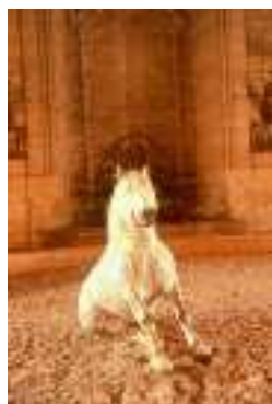
Musée vivant du cheval à Chantilly

Adossée à la Basse Œuvre, rare témoignage de cathédrale carolingienne, la Cathédrale Saint Pierre de Beauvais surprend par ses proportions particulières. De nombreux avatars de construction, dont la chute de la flèche qui culminait à 153m (depuis le niveau du sol) au XVIe s, ont laissé l'édifice sans nef. Mais son chœur gothique du XIIIe s, pareil à une cage de verre de 48,50m sous voûte, représente à