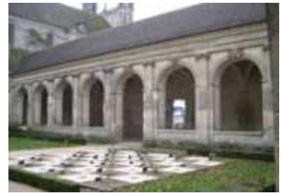
Jardin Médiéval de Laon

Ce jardin, recréé dans le cloître de l'abbaye, comprend 4 éléments : - le damier des plantes médicinales (regroupant 26 végétaux); - les dalles et leurs décors, exécutés localement; - le jardin des plantes potagères (regroupant des variétés cultivées au Moyen-âge); - le verger (arbres fruitiers plantés naguère dans les vergers monastiques, avec leur origine régionale). Tél. : 03.23.26.30.34.