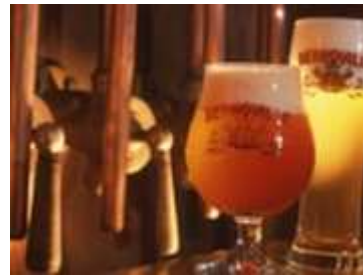
Brasserie de Bernoville

Visite du laboratoire de fumage d'anguilles et de saumons à l'ancienne au feu de bois (procédés de pêche, préparation et façon de fumer). Magrets fumés. Tél. : 03.22.84.13.91.